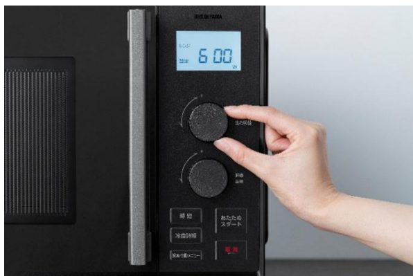
ダイヤル式で操作しやすい