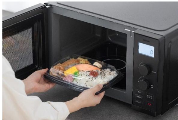
フラットテーブルで食品を入れやすく手入れもしやすい