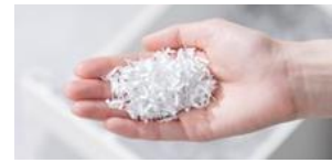
マイクロクロスカット