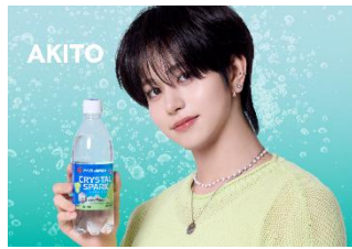
▲CRYSTAL SPARK シャインマスカット 500ml