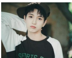
IO (イオ) 2007/1/25 生まれ。 京都府出身。

【VIBY 公式 Instagram】 https://www.instagram.com/official_viby/