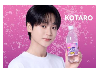
▲CRYSTAL SPARK グレープソーダ 500ml