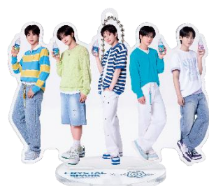
▲賞品画像はイメージです。