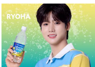
▲CRYSTAL SPARK レモン 500ml