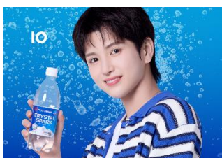
▲CRYSTAL SPARK プレーン 500ml

CRYSTAL SPARK は、心地よい強炭酸と、糖分を気にせず楽しめる無糖のスッキリとした爽やかな味わい、華やかな香りを追求した炭酸水ブランドです。ブランド名には、水のきらめきや輝き、爽やかに弾ける炭酸の爽やかさ、毎日の暮らしに煌めきを添えたいといった思いが込められています。