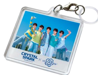
▲賞品画像はイメージです。

※本キャンペーン参加者は、「CRYSTAL SPARK 購入で VIBY グッズが当たる！」キャンペーンの当選確率が上がります。