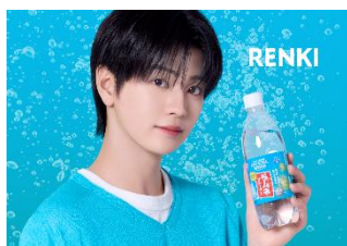
▲CRYSTAL SPARK ラムネ 500ml