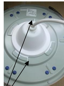
ストッパーが2か所